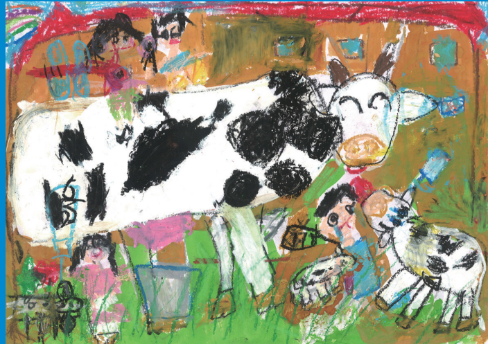
幼児の部 知事賞作品